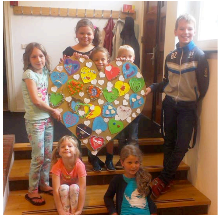
'Dat de kerk het hart van de gemeente mag blijven'